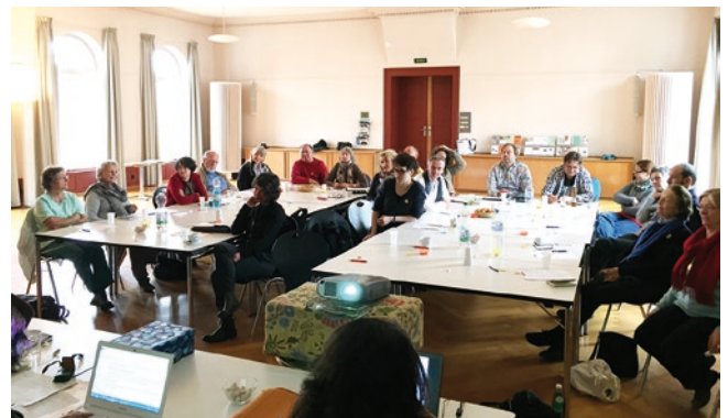
Die Teilnehmer an der HumorCare-GV im grosszügigen Saal des Gemeindezentrum «Hottingen-Zürich» in Zürich.